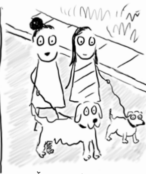
Šunų vedžiojimas (vietinėje prieglaudoje!)