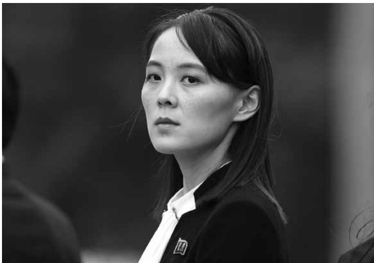
Kim Jodčong vainikų padėjimo ceremonijoje Ho Ši Mino mauzoliejuje Hanojuje (Vietnamas). 2019 metų kovo 2-oji, šeštadienis.