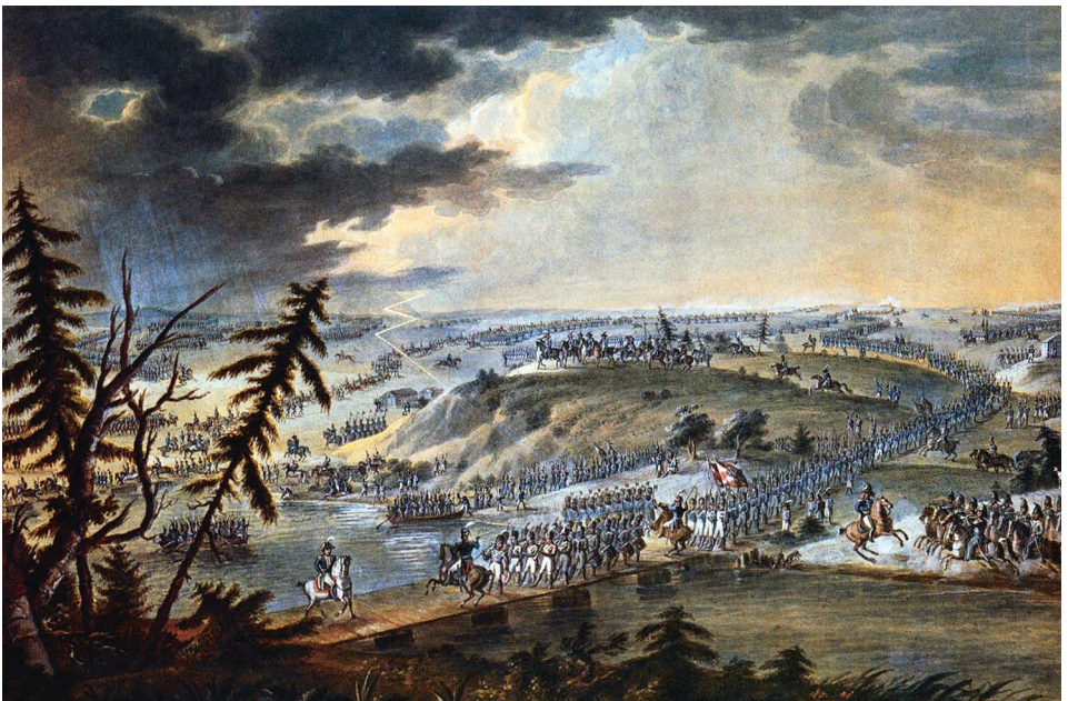
NAPOLEONO KARIUOMENĖ KELIASI PER NEMUNĄ PRIE KAUNO TIES ŠANČIAIS. NEŽINOMAS AUTORIS, 1810.

Beje, Napoleonas juk buvo senajame režime užaugęs karo artileristas! Prancūziškos karo mokyklos buvo tokios geros, kad, net po revoliucijos kariuomenei pasipildžius prasčiokais, tvarka, sukalta dar XVIII amžiaus viduryje, nesuiro. Lietuviai tai matė savo akimis. 1812 metų vasarą keldamasi per Nemuną prancūzų kariuomenė naudojos ikirevoliucinės karinės reformos vaisiais, kai įvedus standartizacijos sistemą pagal tipinius brėžinius iš standartinių detalių pradėti gaminti to paties kalibro pabūklai, sviediniai, vienodo dydžio lafetai, kitokie karo vežimai. Ši Liudviko XV karo inžinieriaus Žano Batisto de Gribovalio ( Jean-Baptiste de Gribeauval ) sugalvota standartizacijos sistema leido tolimais atstumais sparčiai pergabenti didelį kiekį ginkluotės ir karių. Sulūžusį vežimo ratą pakeisti