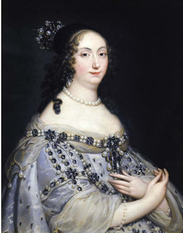
LENKIJOS KARALIENĖ IR LIETUVOS DIDŽIOJI KUNIGAIKŠTIENĖ MARIJA LIUDVIKA GONZAGA. JOOST VAN EGMONT NUTAPYTAS PORTRETAS, 1646. VERSALIO RŪMAI ( Château de Versailles ).