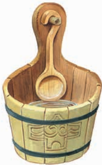
Kubiliukas su samčiu

Į vandenį mediniame kubiliuke kaukučiai įlašina mėtų sulčių.