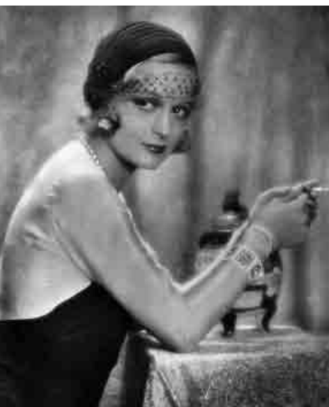
Kamilė Marta Horn, vokiečių šokėja, tylos ir garso eros kino žvaigždė. Atvirukas, Vokietija, XX a. 4 deš. Istorinė Lietuvos Respublikos Prezidentūra Kaune