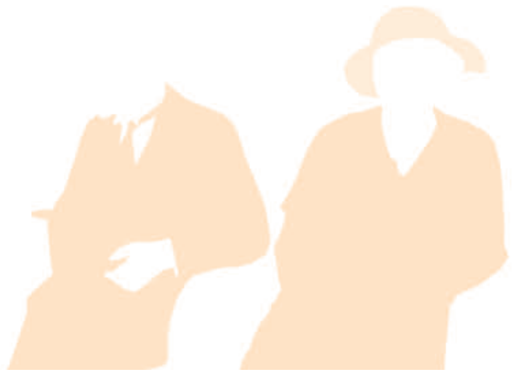
Prezidentas Antanas Smetona su žmona Sofija dalyvauja renginyje. Kaunas, 1933 m.