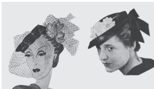
Baltijos šiaudinių ir veltinių skrybėlių fabrikas ekspozicija 7-ojoje Lietuvos žemės ūkio ir pramonės parodoje. Kaunas, 1928 m. birželio 28 – liepos 3 d.