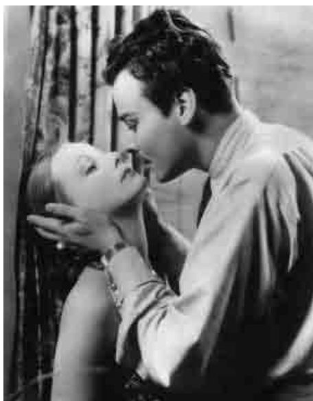
Garsiausi Holivudo aktoriai Greta Garbo ir Nilsas Asteris, vaidinę populiariausiuose XX a. 3–4 deš. filmuose. Istorinė Lietuvos Respublikos Prezidentūra Kaune