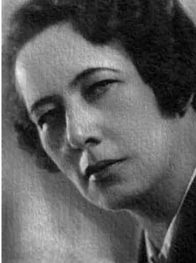
Sofijos Smetonienės portretas. Kaunas, XX a. 4 deš.

klubas“), „Mon bijou“ (liet. „Mano brangenybė“), „Salomėja“, „Sfinks“. Vyrų rinkosi „Florance“ gaminamą skutimosi kremą „Figaro“, dantų pastą „Miradont“ ir kita.