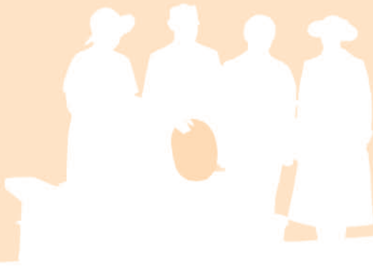
Prezidentas Antanas Smetona su žmona Sofija priima skautų organizacijos įkūrėją Robertą Baden-Pauelį su žmona Olave. Palanga, 1933 m. rugpjūčio 17 d.

drabužiai yra nuolatinė intymių minčių manifestacija, kalba ir simbolis.“ Iš tiesų, drabužiai pridengia kūną, bet taip pat jie daug apie mus pasako. 352