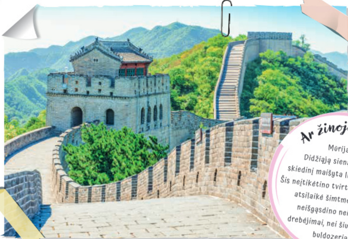
Didžioji kinų siena