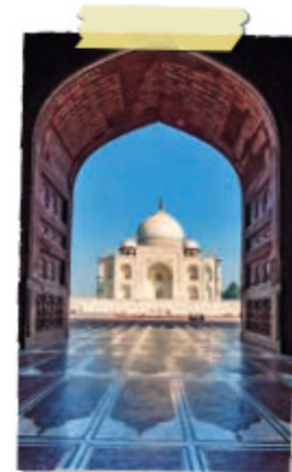
Tadž Mahalis, Agra, Indija