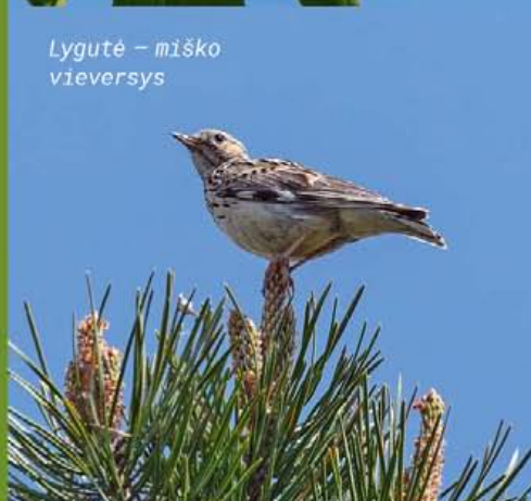
Lygutė – miško vieversys

Miške dar tik prasideda pavasaris, tirpsta sniegas, bet jau gieda karietaitės . Mažas, iki 10 g paukščiukas riesta uodega čiułba taip garsiai, kad jį išgirsti galima už šimtų metrų. Labai greitai miške ima švilpauti juodasis ir amalinis strazdas . Jie slapūs ir baikštūs, tačiau girdint giesmes galima nustatyti, kur šie paukščiai apsistoję ir kur perės. Tik atšilus mišriuose miškuose švelnia giesmele, skambančia iki vėlios nakties, prabyla liepsnelės . Su jomis eglų viršūnėse jau švilpauja strazdai giesmininkai , kurių giesmės gražiausiai skamba anksti ryte ir vakare, saulei leidžiantis.