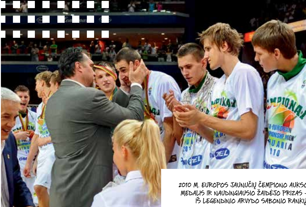
2010 M. EUROPOS JAUNUČIŲ ČEMPIONO AUKSO MEDALIS IR NAUDINGIAUSIO ŽAIDĖJO PRIZAS – IŠ LEGENDINIO ARVYDO SABONIO RANKŲ.