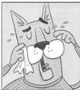
Bučas Roveris – dailidė, nusikaltimo auka

Paklaustas, ar matė vagį, Bučas apsipylė ašaromis ir atsisakė kalbėti. Kūtkiojimui nuslopus, šuo pareiškė, jog patirtis buvo tokia siaubinga, kad jis nė nenori apie tai galvoti.