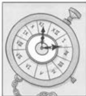
Pavogtas kišeninis laikrodis – šeimos relikvija

Įprastai ramus Būdų Kalvų rajonas per kelias pastarąsias savaites nukentėjo nuo nusikaltimų bangos. Pranešama apie