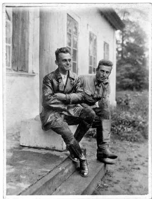
Witoldas Pileckis su draugu Sukurėje, apie 1930 m.

neteisingai palaikydavo kunigu ar geranorišku biurokratu. Mokėjo būti malonus ir nuoširdus, tačiau dažnai susidarydavo įspūdis, kad nėra visiškai atviras: sunku pasakyti, ar iš įpročio, ar dėl įtampos, atsirandančios išreikšti save, vidinis stabdis neleisdavo jam visiškai atsipalaiduoti. Jis buvo griežtas sau ir galėjo būti reiklus kitiems, bet niekada neperžengdavo ribos. Witoldas giliai širdyje pasitikėjo žmonėmis ir jo ramus pasitikėjimas įkvėpdavo kitus pasitikėti juo. 5