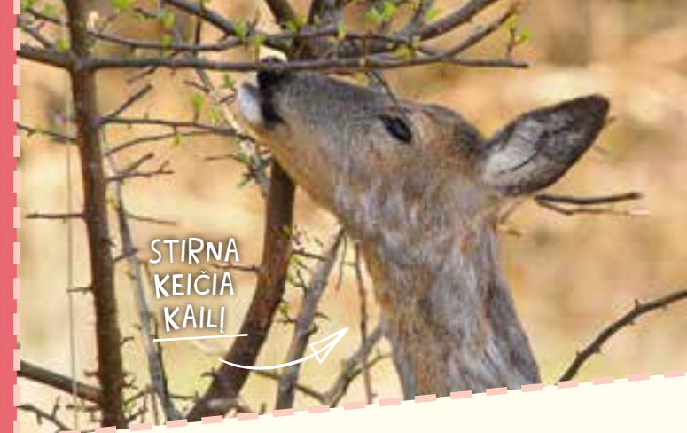
STIRNA KEIČIA KAILI

Žvėrys vasarą turi ploną kailį, o rudenį užsiaugina su povilne – žieminį kailį.