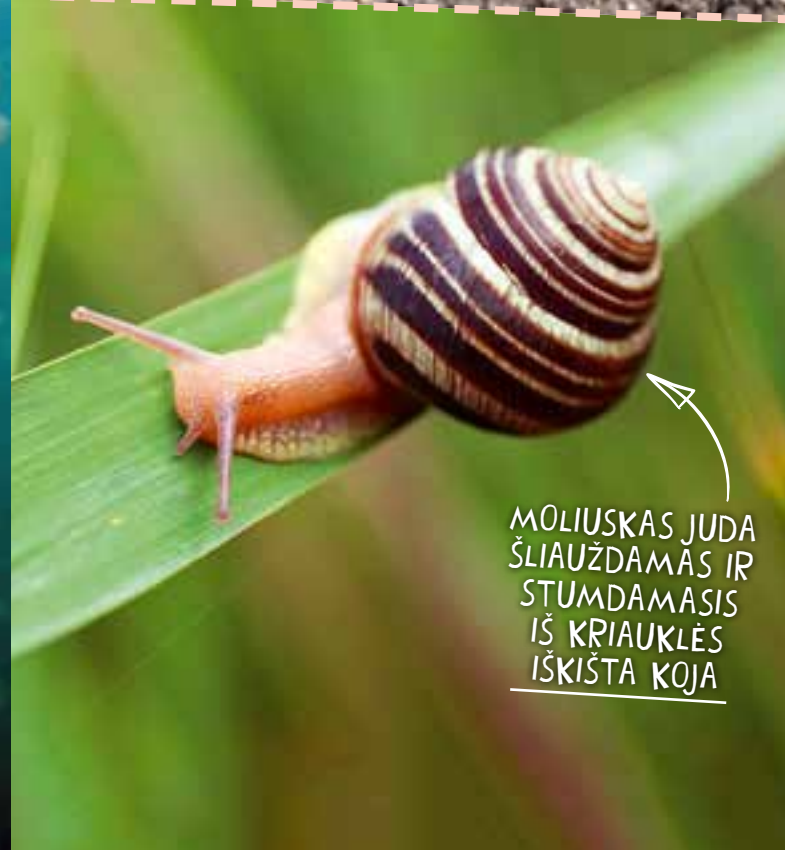
MOLIUSKAS JUDA ŠLIAUŽDAMAS IR STUMDAMASIS IŠ KRIAUKLĖS IŠKIŠTA KOJA

Vabzdžiai turi 6 kojas, daugelis jų gali šokinėti ir skraidyti.