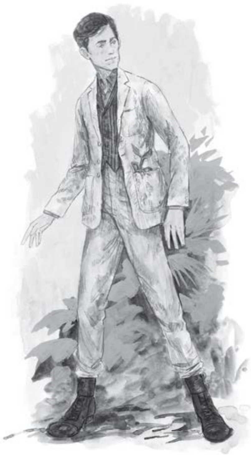
NJUTO MIGLAPŪČIO KOSTIUMŲ ESKIZAI