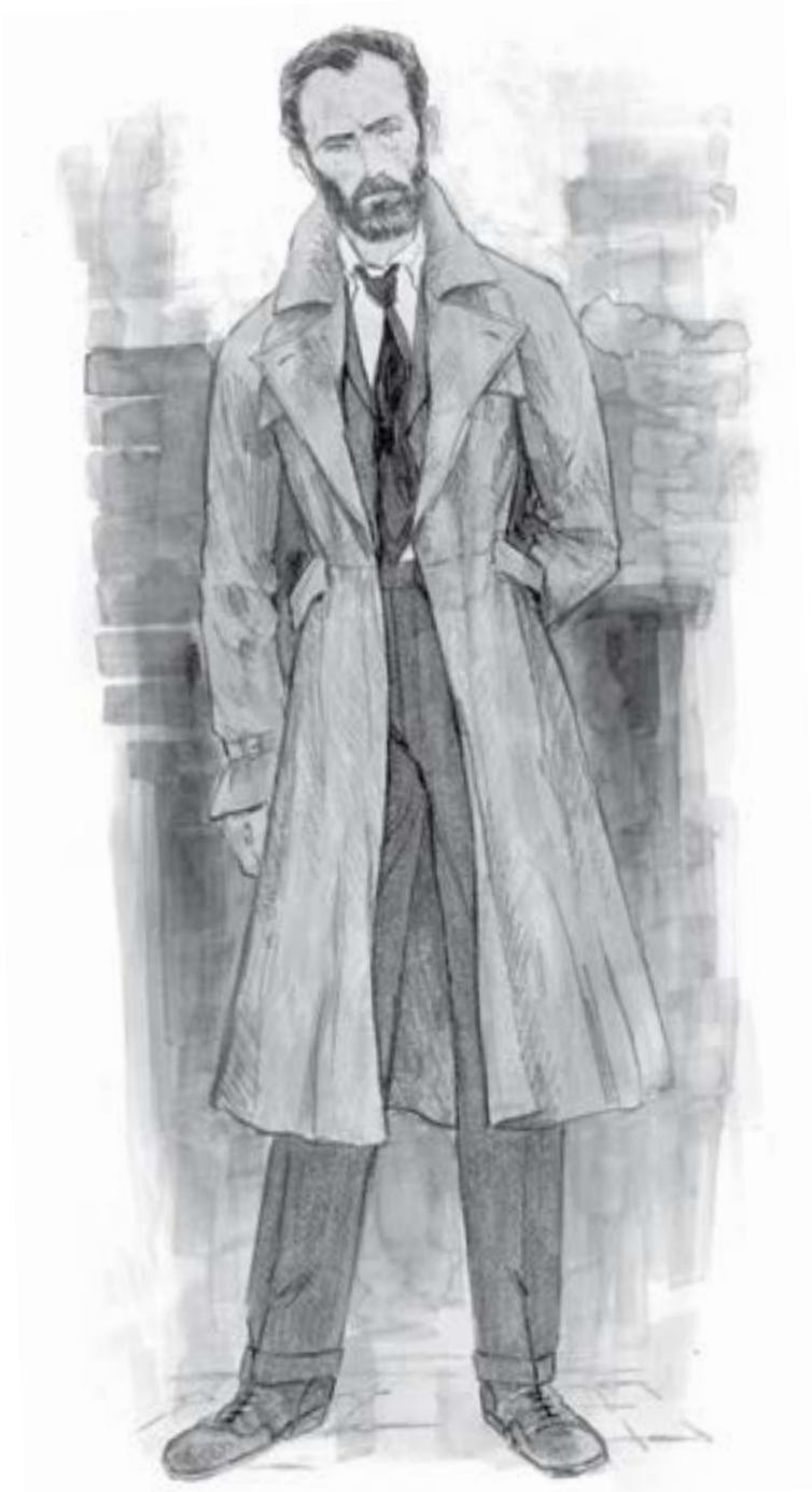
(viršuje) ALBO DUMBLDORO KOSTIUMO ESKIZAS (kitame puslapyje) PRELIMINARI ALBO DUMBLDORO BYLOS ILIISTRACIJA, PALIKTA VIETOS JUDANČIAI NUOTRAUKAI