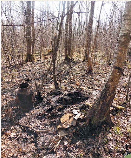
Tauro apyg. Žalgirio rinkt. Dariaus ir Girėno tėvūnijos partizanų archyvo, 1952 m. pabaigoje arba 1953 m. paslėpto bidone (stovi kairėje), radimo vieta Žiemkelio miške (Kauno r.)

— Astos Naureckaitės nuotr., 2018 m. balandžio 10 d.