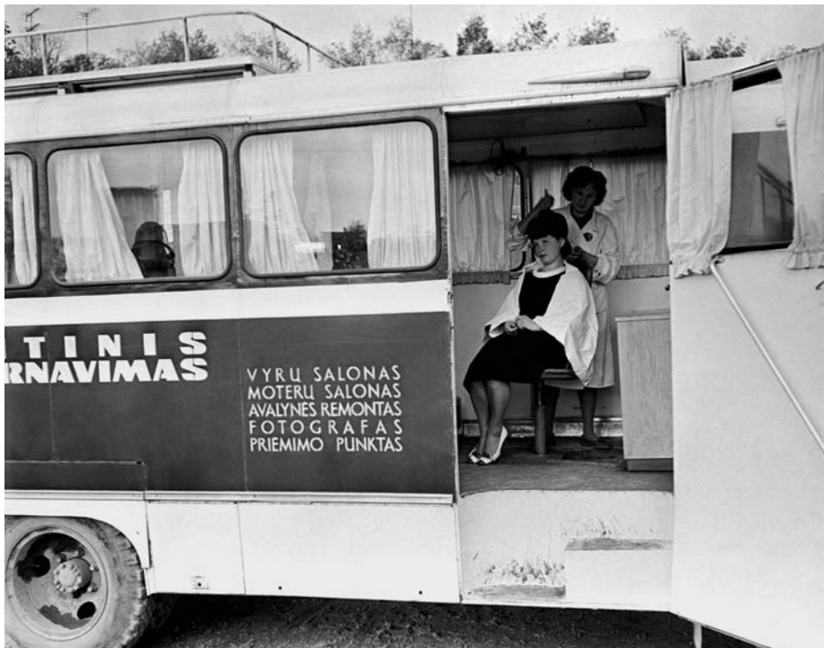
Buitinių paslaugų autobusas. Stop kadras iš laidos „(Pro)Rasta karta“.

Priklausomai nuo rajono komunistų lankstumo ir draugysčių su centre valdžia, miesteliuose kai kur išdygdavo įspūdingi paslaugų centrai. Pavyzdžiui, Šalčininkėliuose didžiulius buitines namus pastatė pats kolūkis, o Ēriškių kolūkis pasistatė modernų centrą, kuriame vienoje vietoje – ir parduotuvė, ir valgykla, ir medicinos punktas, ir patalpos buitiniams.