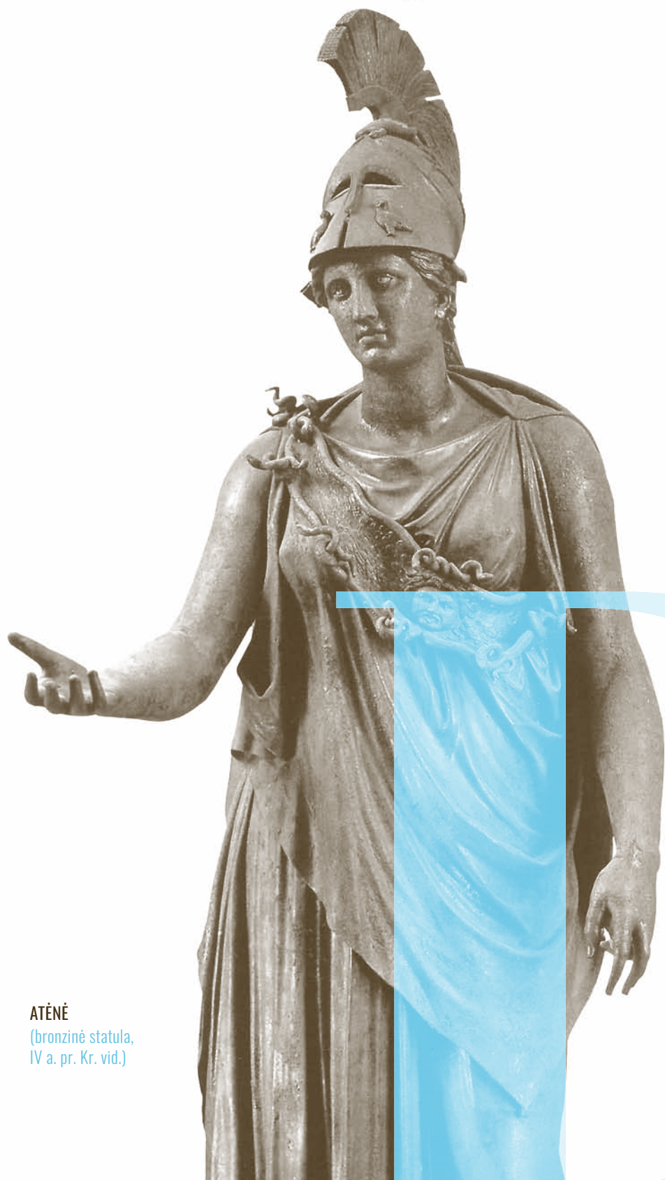
ATĚNĚ (bronzině statula, IV a. pr. Kr. vid.)