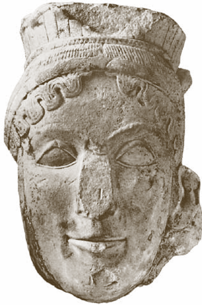
HERA (VI a. pr. Kr.)

Nors Dzeusas siunčia žmonėms laimę ir nelaimę, žmonių likimą lemia Olimpe gyvenančios nenumaldomos likimo deivės – moiros 1 . Paties Dzeuso likimas jų rankose. Valdo lemtis mirtinguosius ir dievus, niekas negali išvengti jos. Nėra tokios jėgos, tokios valdžios, kuri įstengtų pakeisti tai, kas skirta dievams ir mirtingiesiems. Tik moiros žino lemtį. Moira Kloto verpia žmogaus likimo siūlą, nulemdama, kiek jis gyvens. Siūlui nutrūkus žmogus miršta. Moira Lachesė nežiūrėdama ištraukia žmogui tenkantį burtą. Niekas negali pakeisti moirų paskirto likimo, nes trečioji moira Atropė viską, ką paskyrė žmogui jos seserys, susuka į didelį kamuolį, o tai, kas susukta į likimo kamuolį, yra neišvengiama. Nepermaldaujamos didžiosios, rūščiosios moiros.