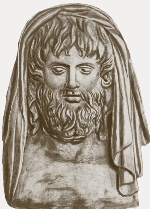
DIEVAS KRONAS – DZEUSO TĒVAS (III a. pr. Kr. biustas)