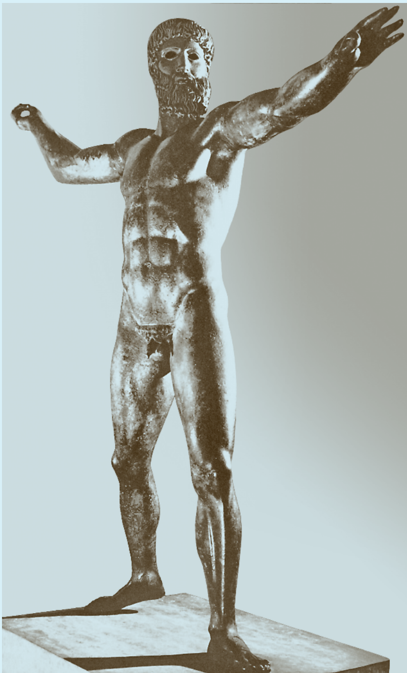
DZEUSAS, SVAIDANTIS ŽAIBUS (PAGAL KITAS PRIELAIDAS – POSEIDONAS) (V a. pr. Kr.)