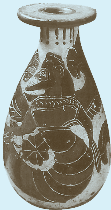
PABAISA TIFONAS (VI a. pr. Kr. vaza)