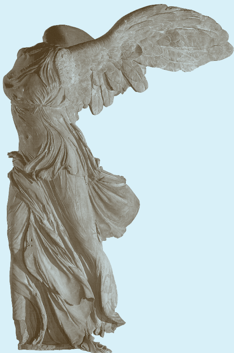
NIKÉ – PERGALĒS DEIVĒ (IV a. pr. Kr.)