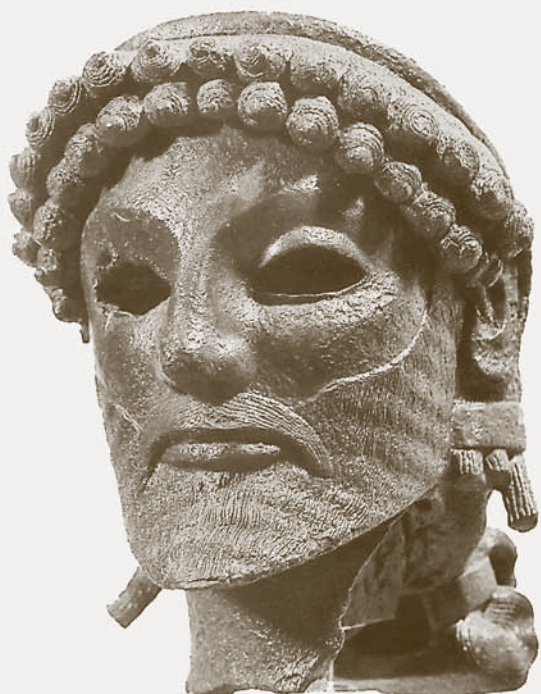
DZEUSAS (V a. pr. Kr.)