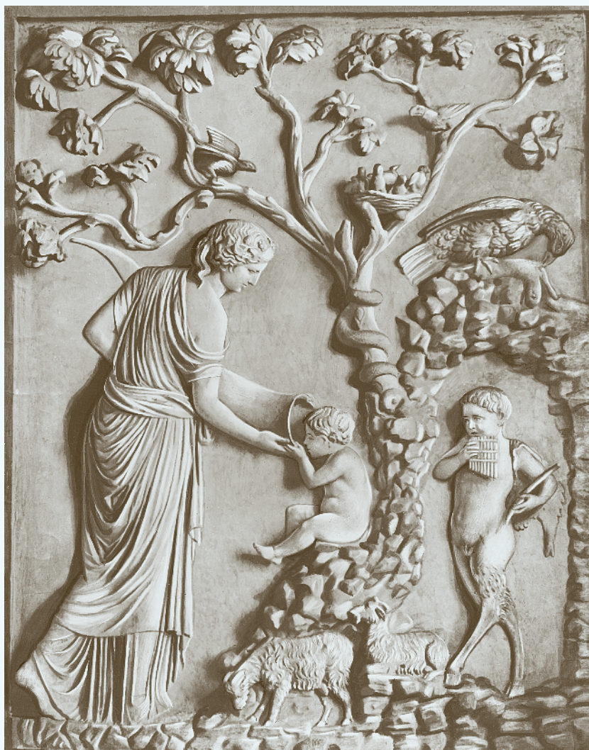
NIMFA ADRASTĖJA MAITINA MAŽĄJĮ DZEUSĄ IŠ OŽKOS AMALTĖJOS RAGO. UŽ DZEUSO STOVĪ MAŽASIS DIEVĀS PANAS, GROJANTIS ŠVILPYNE (II a. pr. Kr. reljefas)