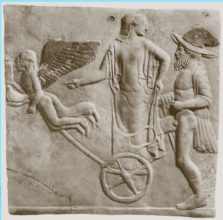
ATĚNĚ IR HERMIS (V a. pr. Kr.)