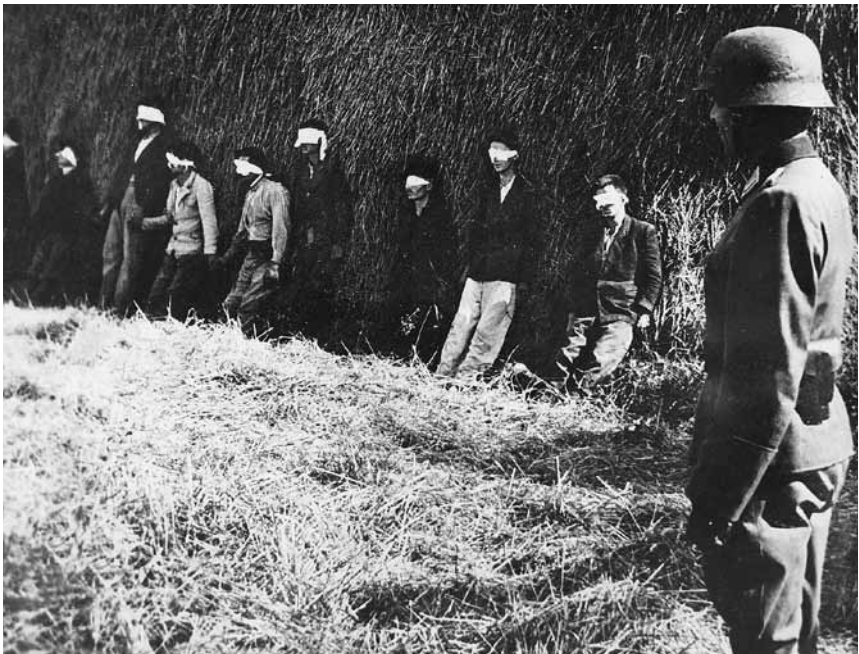
Žydų vyrai laukia šūvio.

Pelytės bastymosi ir grįžimo maršrutas visuomet tas pats: ji išlenda pro Seniucio tvoros skylę ir bėga link kalvos, tuomet pasuka prie geležinkelio bėgių. Gali matyti, kaip ji risnoja per bėgius, tuomet dingsta iš akių ir tik po kurio laiko atsiranda bazėje ant smėlėto geltono kelio, jį kirtusi dingsta tarp medžių. Kartais grįždama ką nors nešasi. Vieną kartą – tai buvo 1943 m. rugpjūtį – ji dantyse nešėsi žarnas, bet kažkieno išgąsdinta numetė jas priešais Seniucio sklypą. Vaikai jas pakabino ant Seniucio tvoros.**