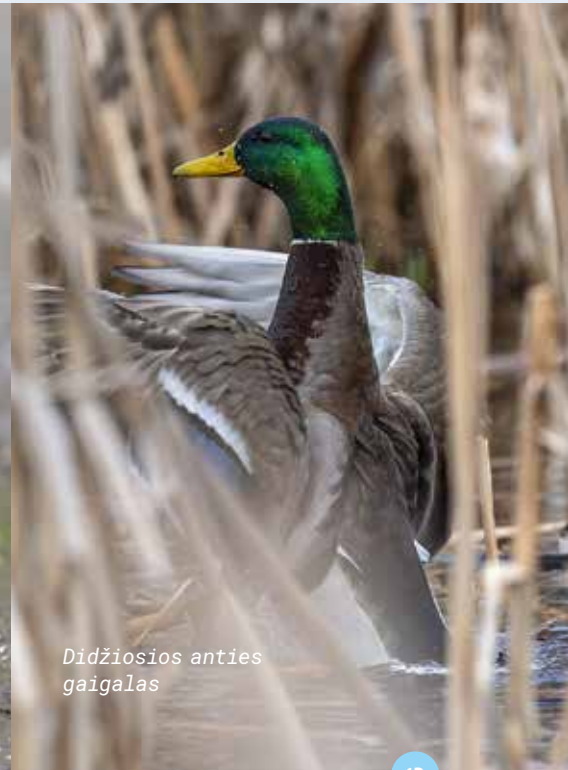
Didžiosios anties gaigalas