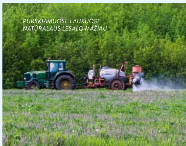
PURŠKIAMUOSE LAUKUOSE NATŪRALAUS LESALO MAŽIAU

Apsižvalgykime aplink: mūsų daržai nedirbami, žemė nepurenama ir neauginamos sėklas teikiančios kultūros. Vejos nušienautos ir vabzdžių jose nėra. Net lapus stengiamasi sugrėbti ir taip sumažinti sliekų gausą. Laukų paukščiams problema kur kas didesnė – monokultūrų laukuose net vasarą vabzdžių reta, be to, šie laukai purškiami nuo kenkėjų. Pievų šienavimas greitaeigė technika veikia primena gyvybę naikinantį malūną nei šieno (žolės) paruošas.