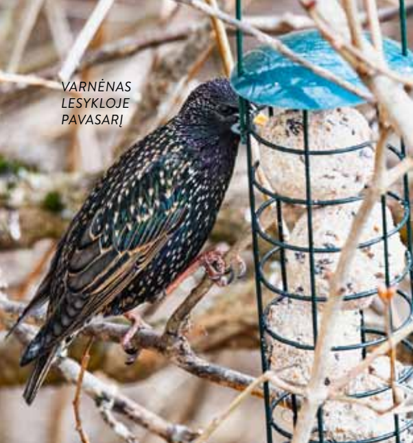
VARNĖNAS LESYKLOJE PAVASARĮ

Ką tokia neapgalvota intervencija į gamtą reiškia paukščiams? Jiems trūksta lesalo. Jo stinga suaugusiems, labai trūksta jaunikliams. Vasarą, jaunikiams palikus lizdus, maisto poreikis padidėja keletą kartų, nes tiek pat padidėjo jų gausa.