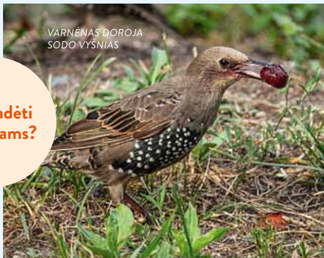
VARNĖNAS DOROJA SODO VYŠNIAS

Pavasarinis paukščių aktyvumas – lizdų sukimas, perėjimas – atima labai daug energijos. Gegužės gale – birželį, lizdus palikus jaunikliams, lesalo reikia ne tik jiems, bet ir suaugusių paukščių energijos praradimui kompensuoti. Todėl lesykla šiuo metu praverčia.