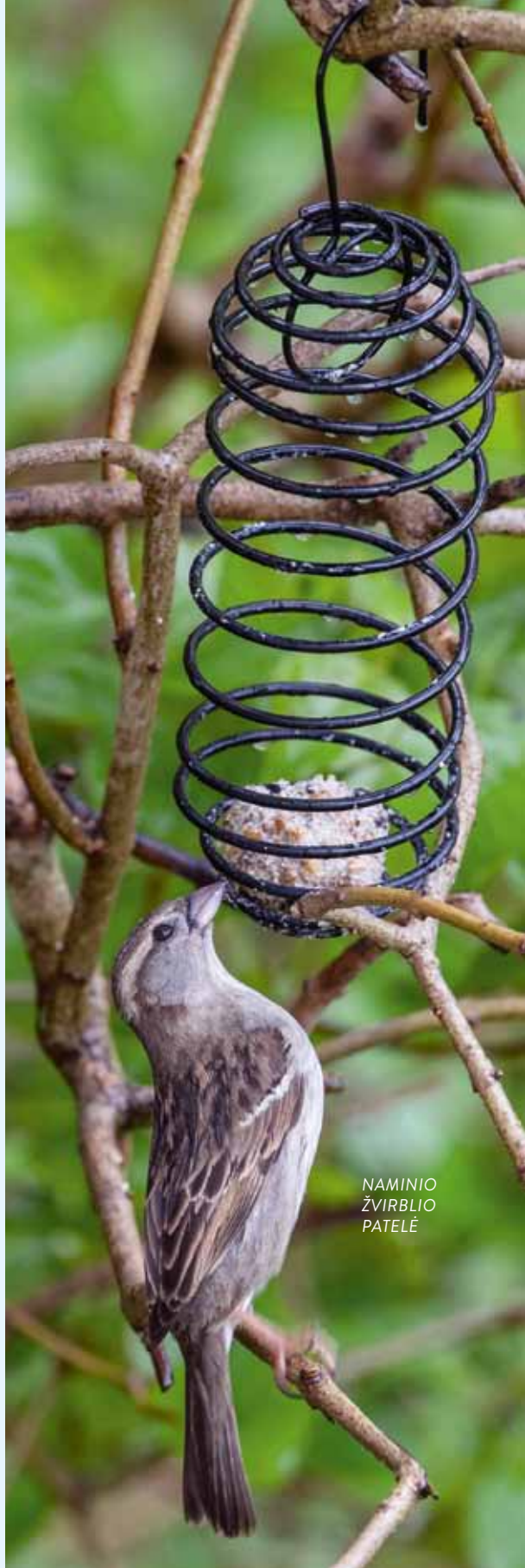
NAMINIO ŽVIRBLIO PATELĖ