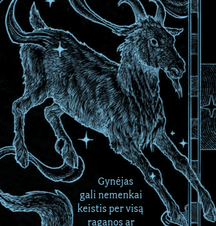
ABERFORTAS DUMBLDORAS Ožka