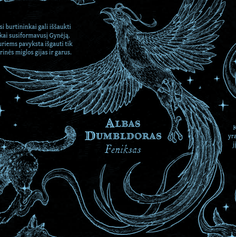
ALBAS DUMBLDORAS Feniksas