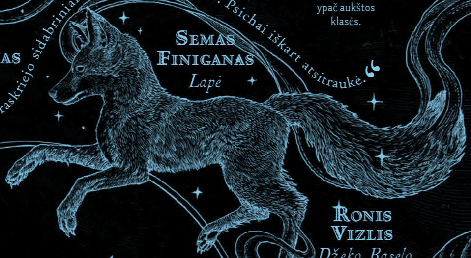
SEMAS FINIGANAS Lapė