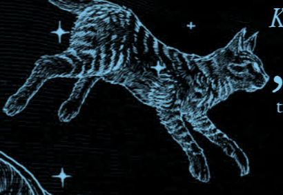
MINERVA MAKAGONAGAL Katė