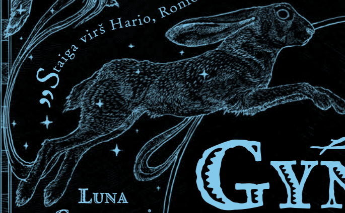
LUNA GERANORĖ Kiškis