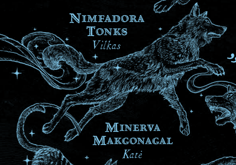
NIMFADORA TONKS Vilkas