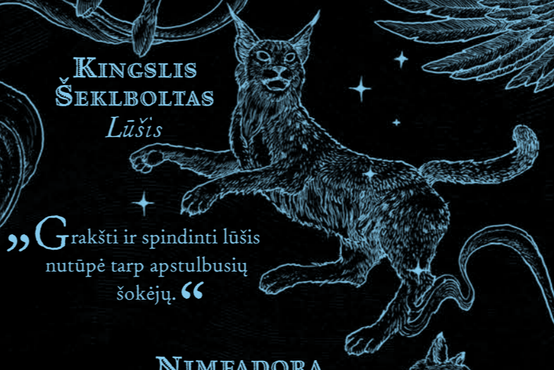
KINGSLIS ŠEKLBOLTAS Lūšis